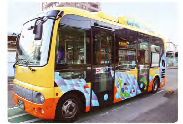
●小型ノンステップバス ※デザインは変更する場合があります。 西12 西21 西30 東10 東20 東30 東40

桶川市民生活部安心安全課 TEL 048(786)3211(代) 令和2年6月発行