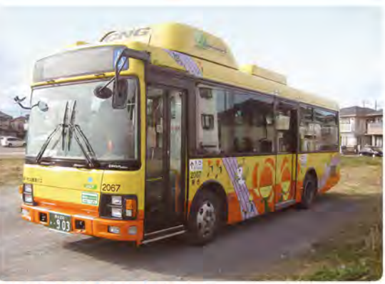
●中型ノンステップバス ※デザインは変更する場合があります。 西10 東11 スイカ・バスモ等のICカードがご利用できます。